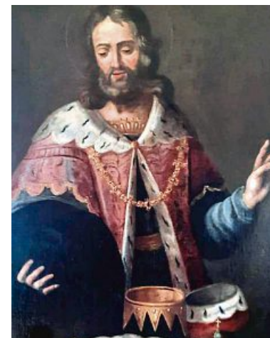
Herzog Tassilo III. kam vor 1250 Jahren zur Synode nach Neuching.