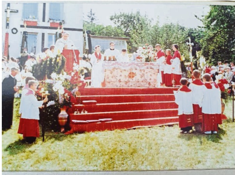
Schon vor 50 Jahren wurde das Jubiläum zur Synode vor – damals – 1200 Jahren groß gefeiert.