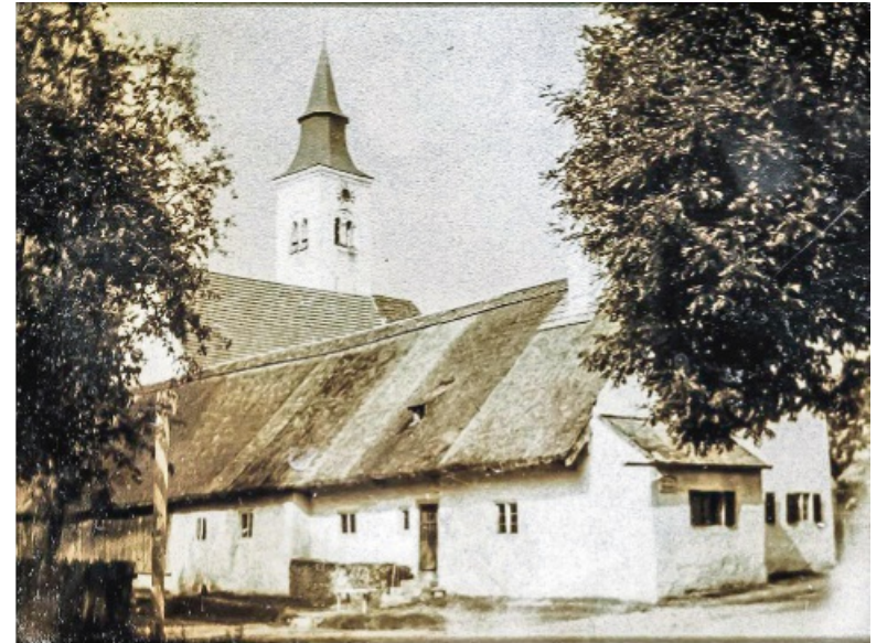
Der Sattler-Hof in Oberneuching, dessen erste Erwähnung aus dem Jahr 1305 stammt.